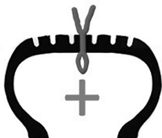
Правильная установка жгута