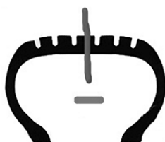
Неправильная установка жгута